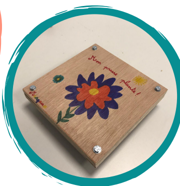
Fabrication d'un presse plantes