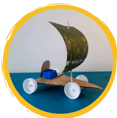
Construction d'un char à voile

À chaque séance, les enfants découvrent un enjeu écologique autour d'un jeu et d'une histoire. L'année commence par une exploration à travers une des grandes histoires de l'humanité : les énergies ! Les enfants découvrent les sources d'énergie de la Terre dans le cadre d'une mission secrète et deviennent les gardiens des énergies ! Au deuxième trimestre, les enfants participent au grand jeu Forêt-Boyard à la découverte des supers Héros de la forêt et de leurs pouvoirs . Au dernier trimestre, les enfants imaginent et mettent en place leur projet personnel pour l'environnement à l'échelle de l'école ou s'initient au jardinage . En lien avec ces thèmes, les enfants fabriquent de superbes créations en récup' à ramener à la maison tout au long de l'année !