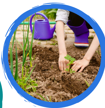
Au 3ème trimestre, les enfants font du jardinage ou réalisent un grand projet commun !

Ateliers les vendredis de 11h30 à 12h30, du 13 septembre 2024 au 27 juin 2025.